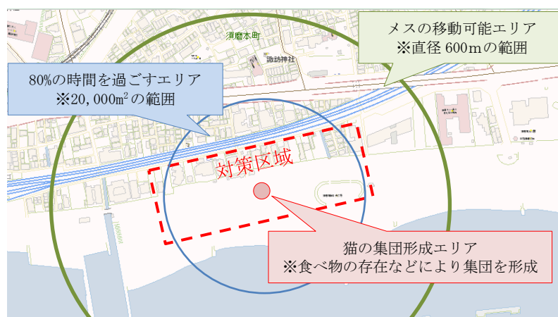
<対策区域（案）の策定>

メス猫の移動可能エリアのうち、餌場等を中心とした半径 80 メートルのエリア (20,000m 2 の範囲) を猫の活動エリアと考え、道路、河川、鉄道等を加味して繁殖制限対策区域を策定することとしており、事前調査の結果に基づき、協議会事務局が対策区域案を策定する。