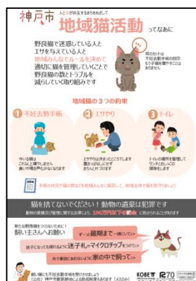
<地域猫活動啓発リーフレット>

本市では一定の条件を満たす団体を地域猫活動団体として登録を行っており、責任をもって地域猫活動を行う証として腕章を交付した。平成30年度の登録団体数は 121団体 であった。地域猫活動登録団体へは、1年に1度、活動状況を市へ報告することを義務付けている。