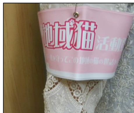
<地域猫活動登録団体 腕章>