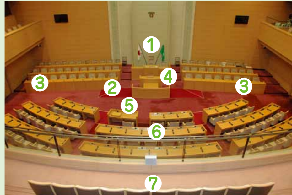
市役所の29階にある本会議場で行われます。市会議員全員と市長や副市長が出席します。