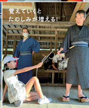
覚えていくと たのしみが増える!