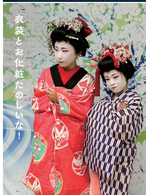
衣装とお化粧たのしいな!