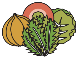
山田と淡河の野菜