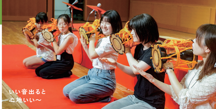
いい音出ると 心地いい～