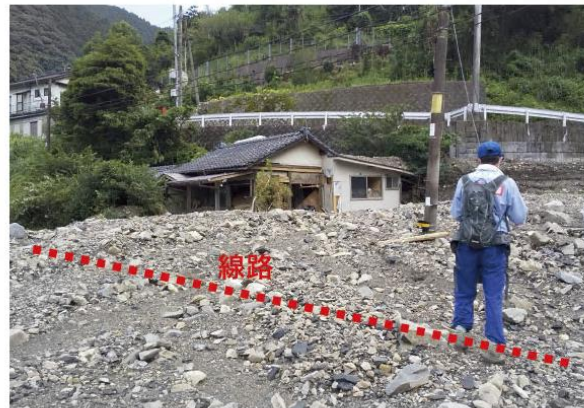
球磨村 (大坂間地区)