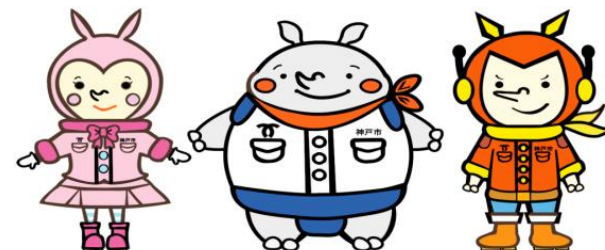
神戸市防災啓発キャラクター 「どすこい防サイくん」とその仲間たち