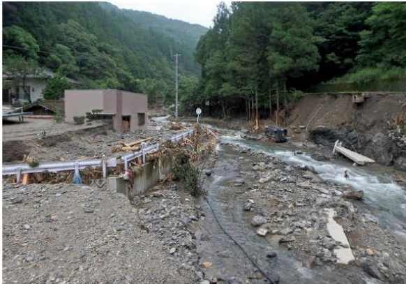
八代市坂本町 (鎌瀬地区)