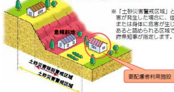
【土砂災害警戒区域の指定】

※「土砂災害警戒区域」とは、土砂災害が発生した場合に、住民等の生命または身体に危害が生じるおそれがあると認められる区域であり、都道府県知事が指定します。