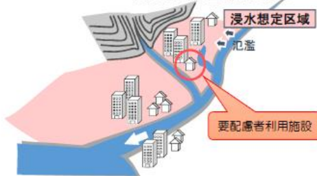
【浸水想定区域の指定】

※「洪水浸水想定区域」とは、河川が氾濫した場合に浸水が想定される区域を指します。