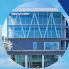
神戸アイセンター病院