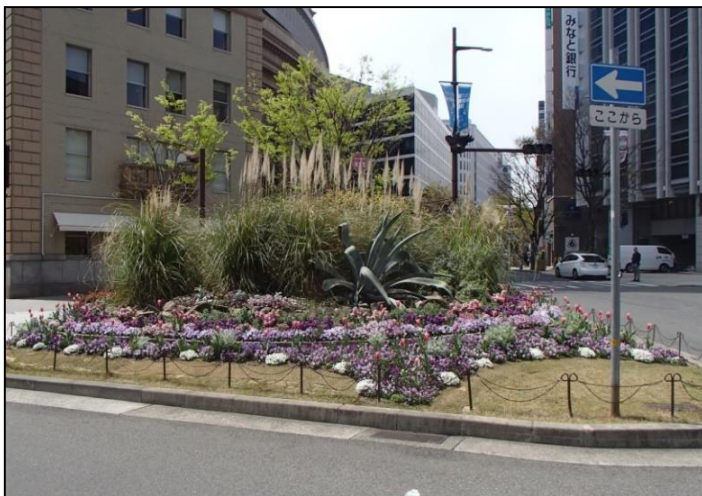
8. 西日本電信電話(株)兵庫支店