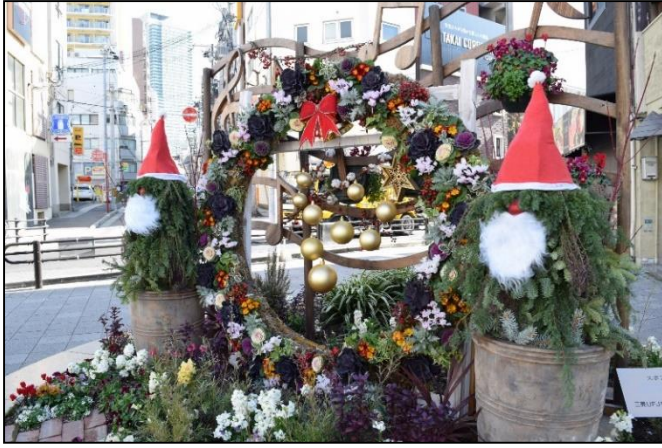
13. 三菱UFJモルガン・スタンレー証券(株)