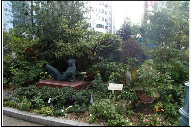
14. 三菱UFJモルガン・スタンレー証券(株)