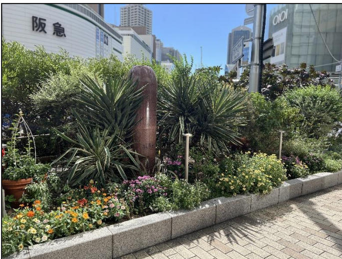
5. (株)グランビスタ ホテル&リゾート