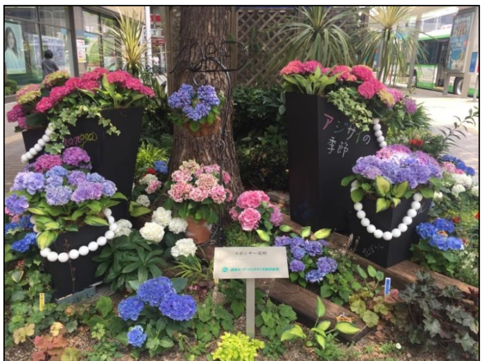
9. 日本ロードメンテナンス(株)