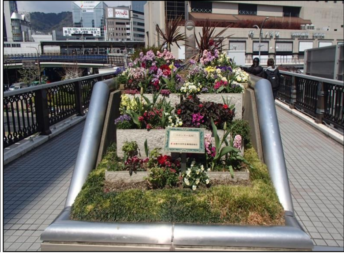
2. 播州信用金庫職員組合