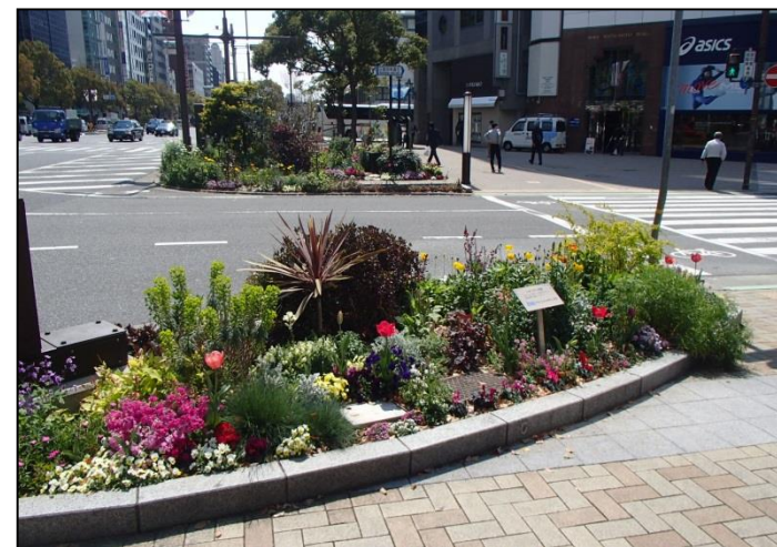
11. ブリッジメンテナンス(株)