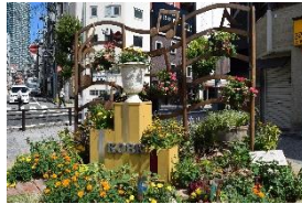
Floral Installation花壇のイメージ写真

※現在、神戸市では「自然の景」の創出による新たな緑と花のブランディングの取り組み