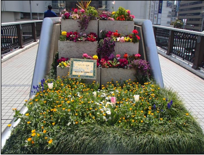
1. 一般社団法人神戸市造園協力会