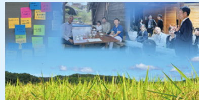
日本酒をコアにした農業の多面的価値創造へ

ノーベル賞晩餐会の銘酒「福寿」で有名な270年続く酒蔵。酒米づくりも持続可能にする「サステナブル・トランスフォーメーション」に挑戦し、エコツーリズムを含む国際ブランド化を進めます。