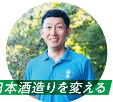
日本酒造りを変える