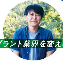
プラント業界を変える