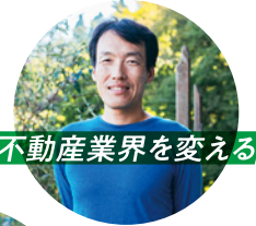
不動産業界を変える