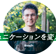
コミュニケーションを変える