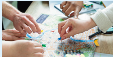
共感価値起点の不動産ビジネス開発を進めています

社会変化に対応できていない不動産業界と地域のあり方のアップデート。市街地の遊休不動産を経済的価値だけでなく社会的価値も含めて高めていきます。