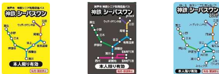
神鉄シーパスワン・神鉄シーパスワン plus・神鉄シーパスワン北神券面

令和6年度は、割高感のある「神鉄シーパスワン plus」を、他の乗車券の割引水準となるように販売価格引き下げを行う。