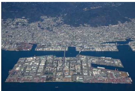
六甲アイランド（南側より）