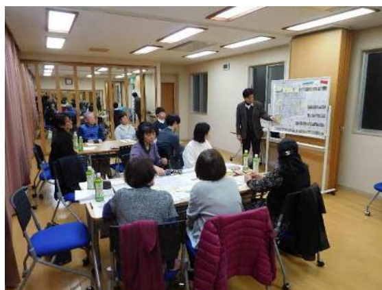
専門家を交えた会議の状況