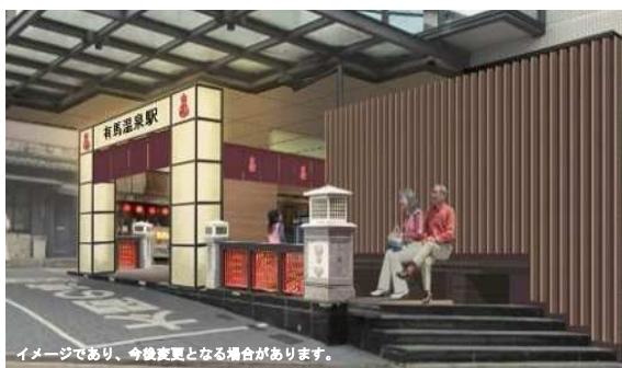
イメージであり、今後変更となる場合があります。