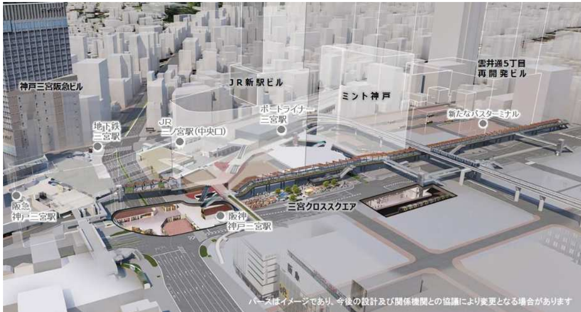
三宮駅周辺デッキ（イメージ）