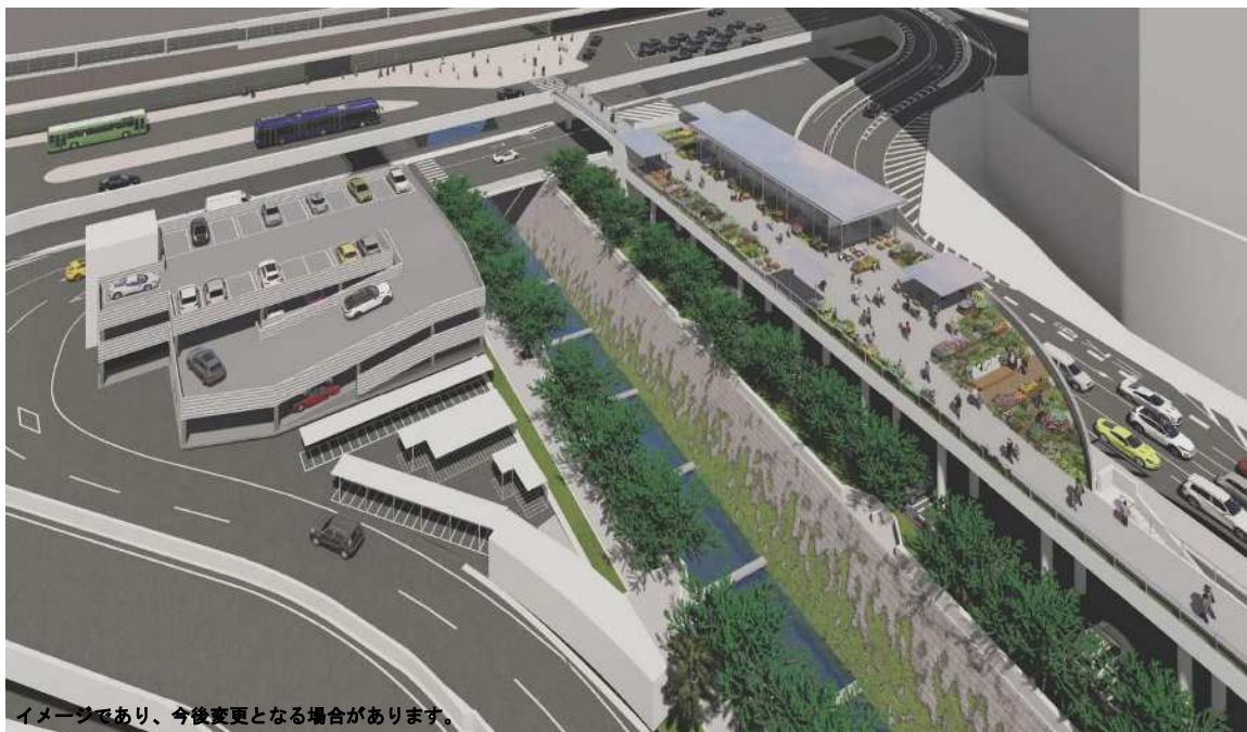
新神戸駅周辺の再整備（イメージ）