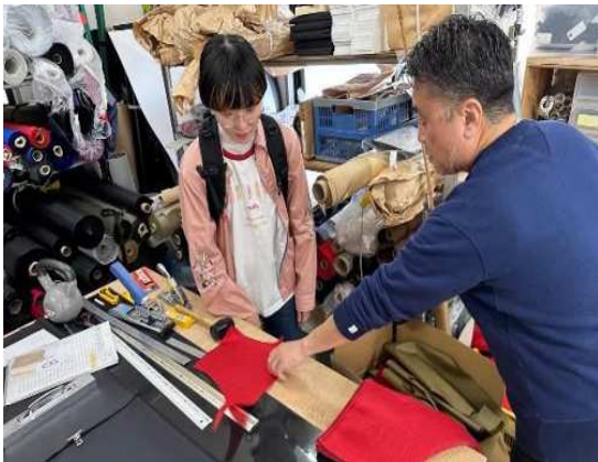
起業家支援（地元事業者との連携の様子）