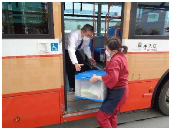
路線バスを活用した移動販売