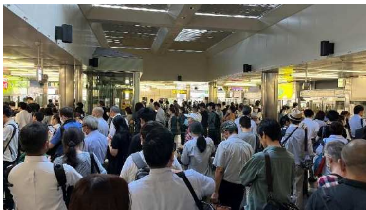
神戸新交通三宮駅の朝ラッシュ時における混雑状況(令和5年9月)