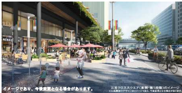
三宮クロススクエア（第1段階）イメージ