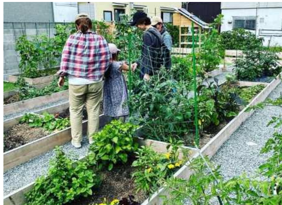
空き地の農地活用事例（長田区内）