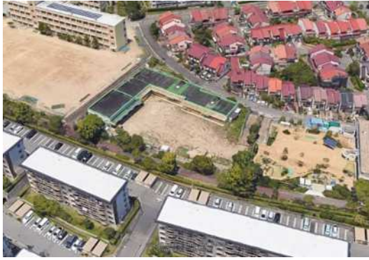
こすもす幼稚園（現況）