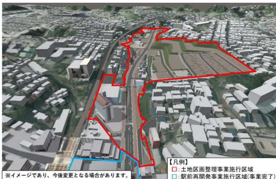
鈴蘭台駅北地区土地区画整理事業（イメージ）