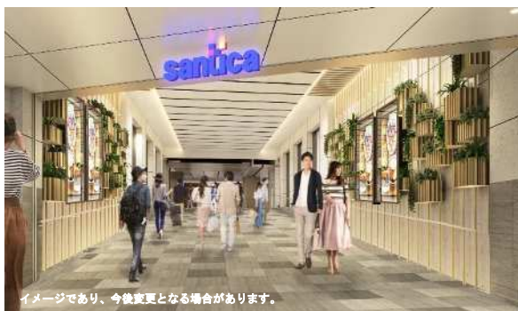
リニューアル後のさんちか（イメージ）