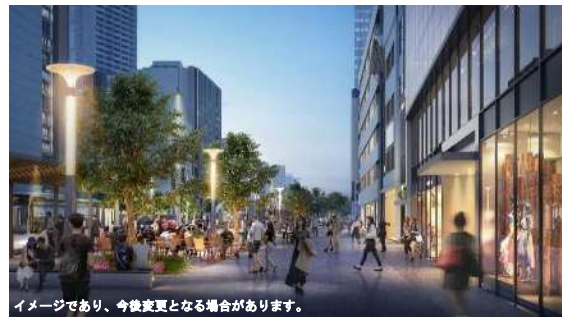
センター街東口周辺（イメージ）