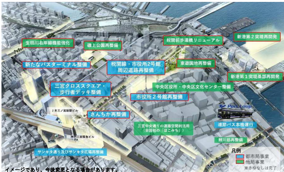
都心・三宮の再整備

神戸の都心の活性化と魅力的で風格ある都市空間の実現に向け、神戸の都心の未来の姿〔将来ビジョン〕及び三宮周辺地区の『再整備基本構想』に基づき、着実に具体的な取組みを進める。