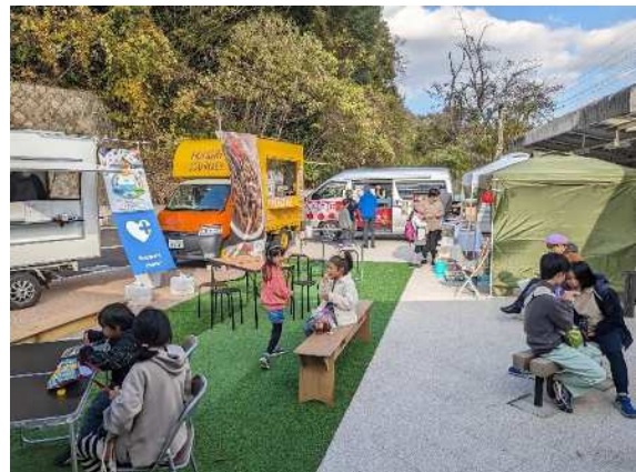
駅前広場を活用したイベント（花山駅）