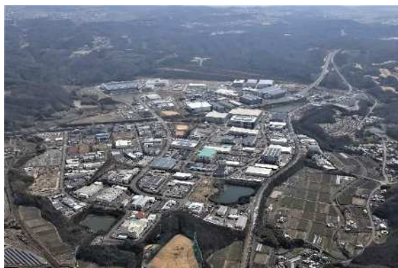
神戸複合産業団地（北西側から）