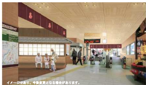
イメージであり、今後変更となる場合があります。