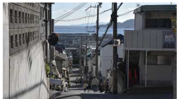
歌敷山 路地（垂水区）