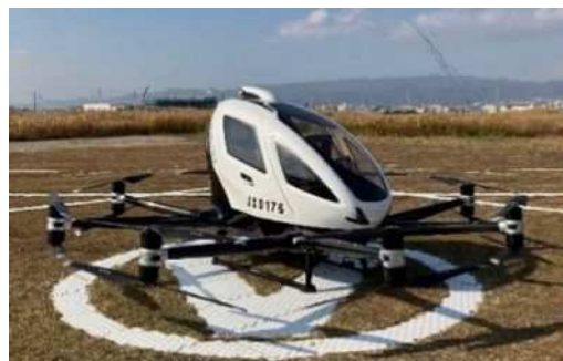
空飛ぶクルマ（令和5年度実験の様子）