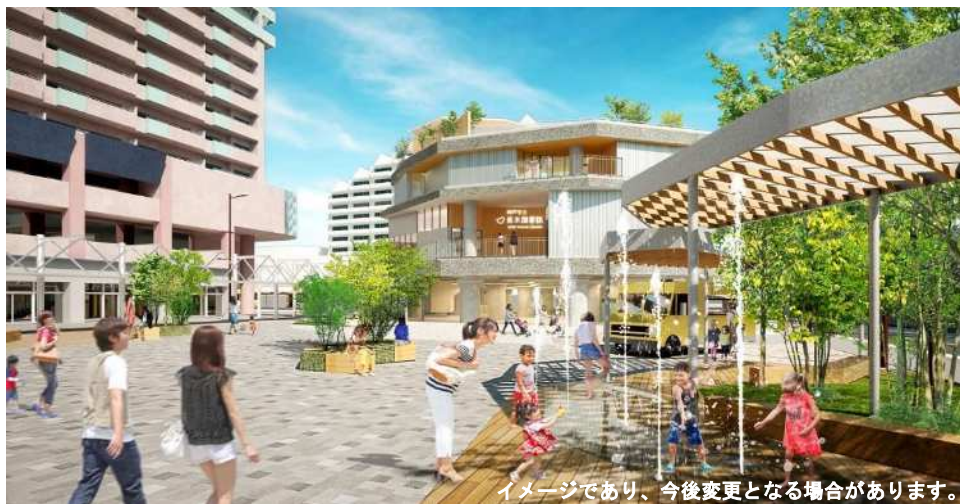
垂水駅前東広場 (イメージ)