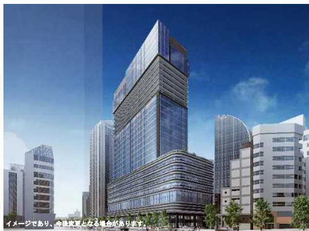
本庁舎2号館再整備事業 (イメージ)