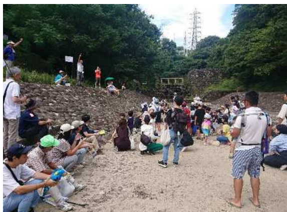
まちづくり団体の活動状況（まち歩き）