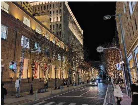
夜間景観形成整備（旧居留地）