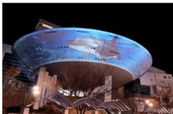
プロジェクションマッピング