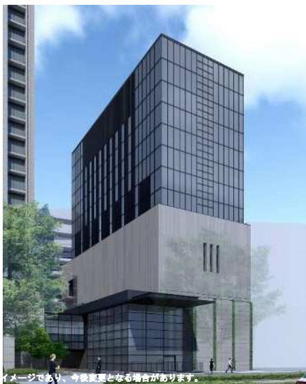
(仮称)連絡ロビー・エネルギー施設 (イメージ)