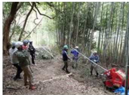
多井畑西地区における取組み（交流広場プレーパーク、市民グループによる竹林整備活動）