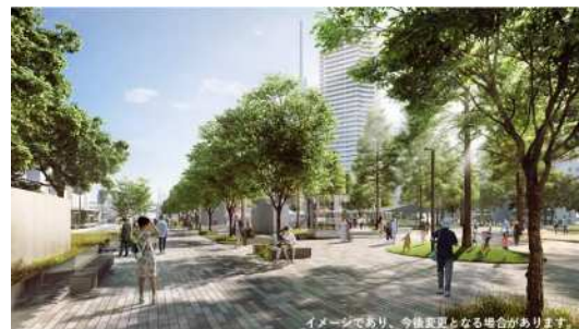
税関線の整備（イメージ）