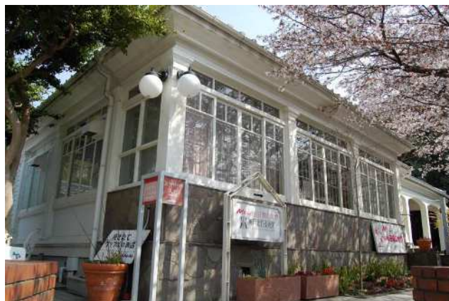
旧アメリカ領事館官舎（指定景観資源）