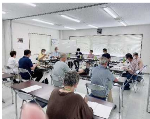
地域へのアプローチ（出前トーク）の様子