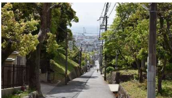
城の下通 地獄坂（灘区）