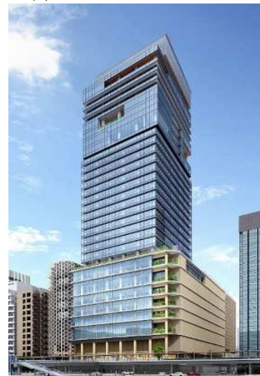
イメージであり、今後変更となる場合があります。