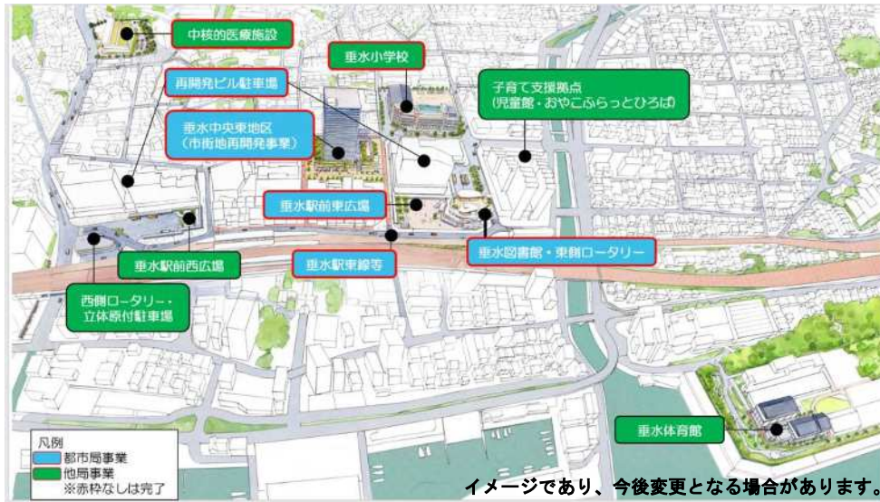
垂水活性化プラン