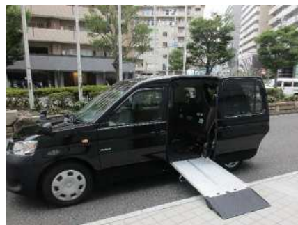
ユニバーサルデザインタクシー