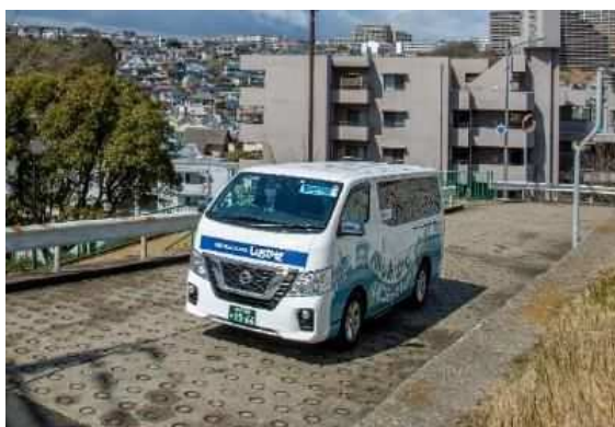
垂水区塩屋地区 コミュニティバスしおかぜ