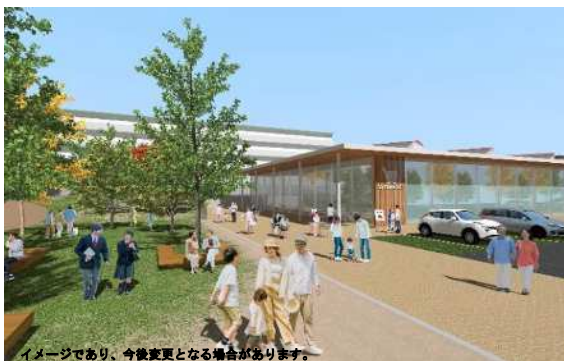
かりばプラザリニューアル（イメージ）