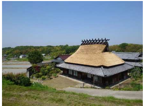
茅葺民家（指定景観資源 北区淡河町）