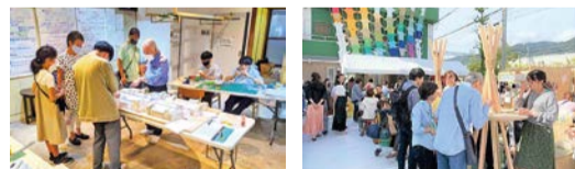
▲スタディ模型づくり

建築大学生として地域の人々の想いを形にしたことです。灘中央市場の防災空地の設置を検討するために「スタディ模型」を作成したときには、シャッターや通路幅を忠実に再現し、市場の現状と変化がわかりやすく確認できるように工夫しました。また「まや六甲マルシェ」の会場レイアウトをデザインしたこともあります。様々な高さのオブジェを椅子や机と見立て、来場者が自由な使い方ができるようにしまし