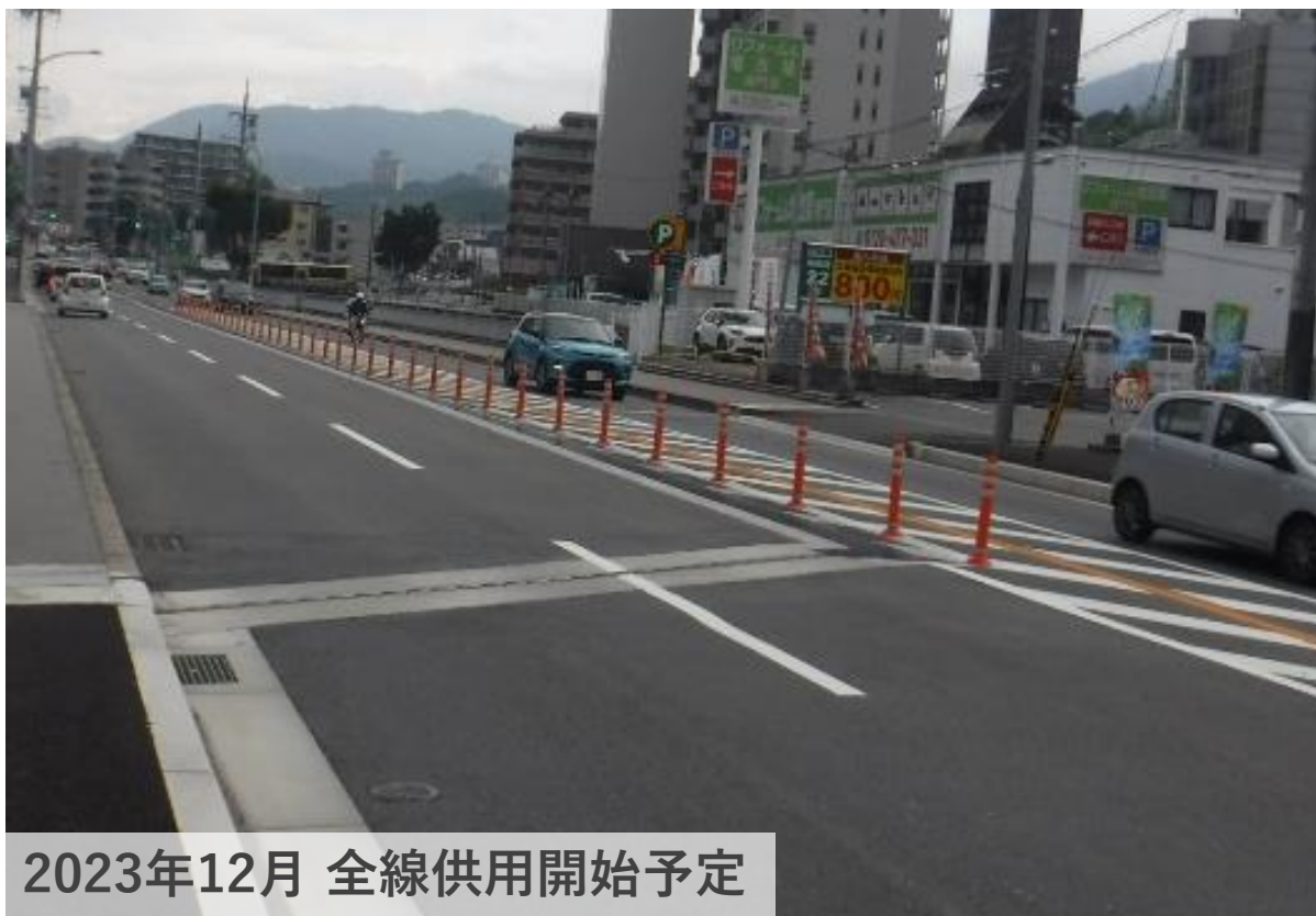
2023年12月 全線供用開始予定