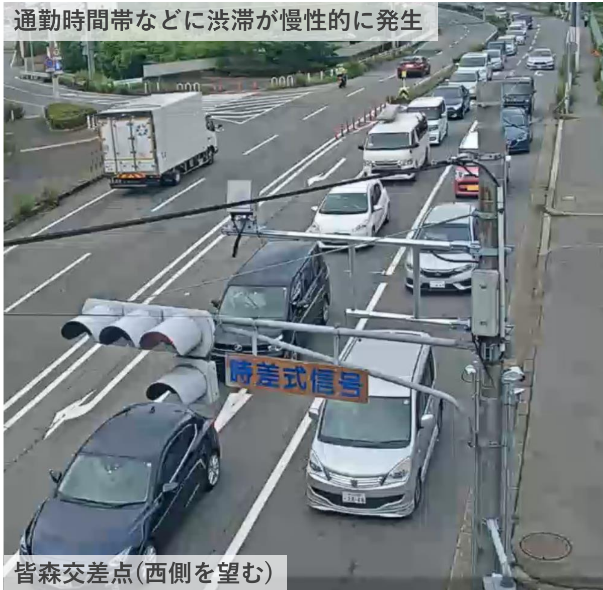
皆森交差点(西側を望む)