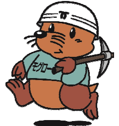
神戸市下水道部 マスコットキャラクター 「モグロー」