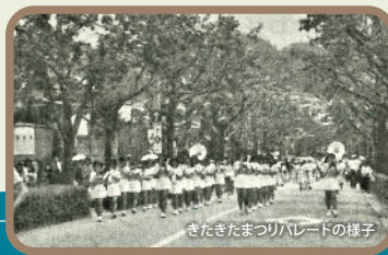
きたきたまつりパレードの様子