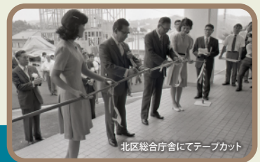
北区総合庁舎にてテープカット