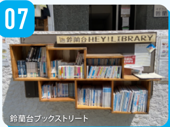
鈴蘭台ブックストリート