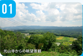
光山寺からの眺望景観