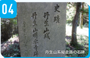
丹生山系縦走路の石碑