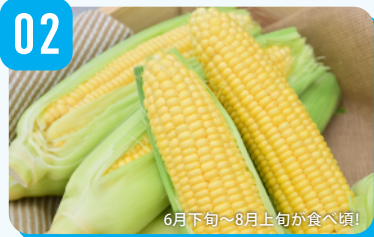
6月下旬~8月上旬が食べ頃!