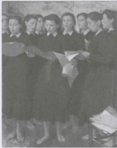
《合唱》1941年 兵庫県立美術館蔵