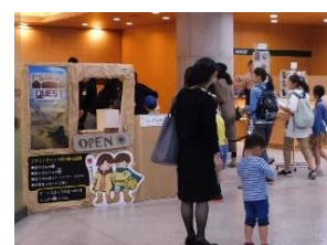
美術館内ロビー・ミュージアムクエストの様子