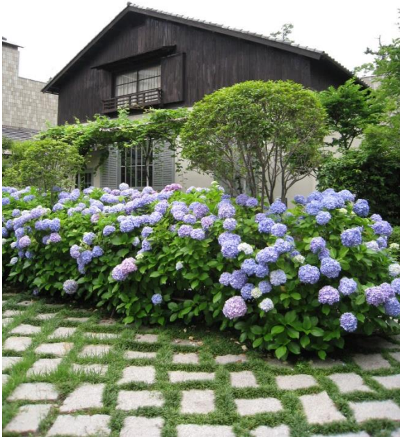
中庭に移築・復元されたアトリエ

毎開館日の午前・午後の各1回、アトリエ内でインフォメーション・スタッフによる小磯良平の解説会を行っている。