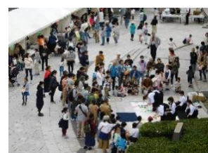
美術館前広場・書道パフォーマンスの様子