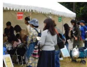
美術館上芝生ゾーン・どんぐりマーケットの様子