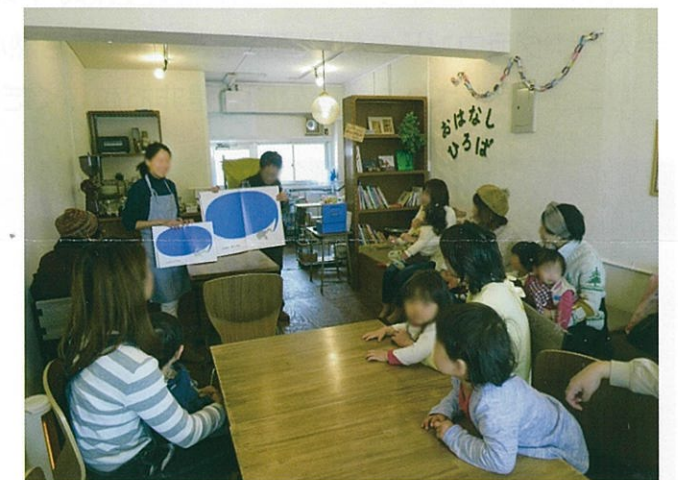
たもん・センター・カフェ!でおはなしひろば