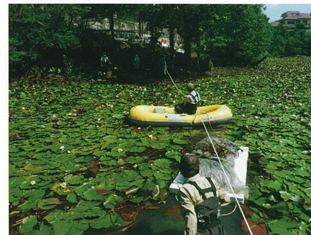
松ヶ池公園でスイレンの駆除作業

また、多聞台中央公園に近接した建物内に「たもん・センター・カフェ!」をオープンさせ、「おはなしひろば」などの各種イベントを開催し、多聞台中央公園と合わせて地域コミュニティの拠点づくりに取り組んでいます。