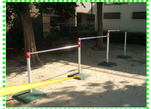
ラバーを貼った後