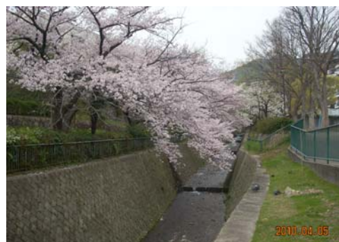
王子公園・青谷川沿のソメイヨシノ

これからも神戸のまちを彩る桜を、愛着をもって見守りくださいますようお願いいたします。