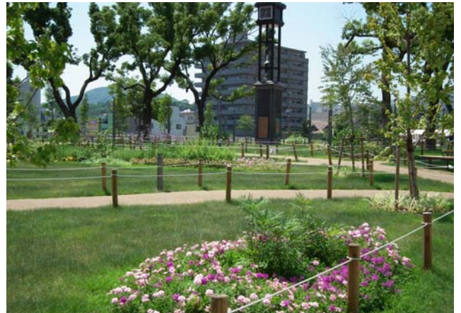
新しく生まれ変わったガーデニング広場と芝生ゾーン

湊川公園は、2008年からはじまった改修工事が終わり、ついに今年3月に13個の大小の花壇と緑豊かな芝生ゾーンでできたガーデニング広場が誕生しました。花壇には、ボランティアの手によって、季節ごとに花が植え替えられ、公園に彩りをもたらしてくれます。かつての湊川公園のイメージを一新し、まちな人が集う明るい空間に生まれ変わりました。