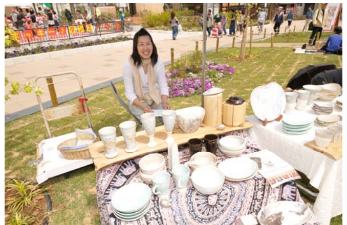
毎月定期開催する「アート縁日」のようす