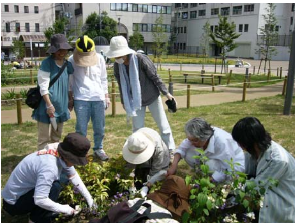
ボランティアによる花壇の植替え作業

季節の花を見に来たり、ボランティアとしてガーデニングを楽しんだり、イベントに参加したり、お散歩の新しいコースに加えたりなど、リニューアルされた湊川公園へ是非お越し下さい。