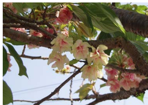
ウコン（黄桜）の開花