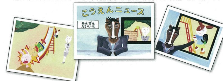
【紙芝居】こうえんニュース

遊ぶ前には服装や遊具のチェックも忘れずにして、楽しく安全に遊んでもらいたいですね。