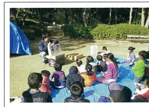
【市内公園イベントにて】みんな真剣に聞いてくれています

話を聞いてくれた子ども達からは、「ケガをしないように、みんなで気を付けて遊ぶようにしたい」「友達同士で服装チェックして遊ぶようにしたい」等の感想をいただいています。