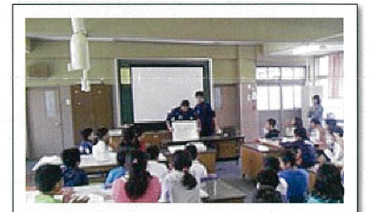
【みち・みず・みどりの学校にて】トライやるウィークの中学生にもお手伝いしてもらいました