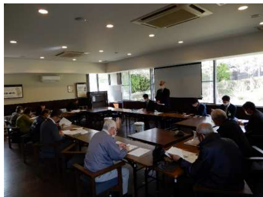
(運行事業者の公募の様子)

今後は、青葉台・柏尾台に巡回バスを走らそう会と神鉄タクシー(株)、神戸市が連携協力して、令和5年度中の試験運行の実施に向けて取り組みを進めてまいります。