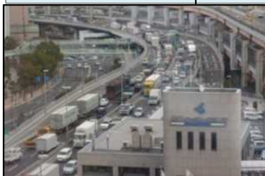
阪神高速3号神戸線