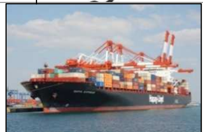
国際コンテナ戦略港湾