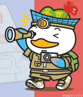
中央区キャラクター かもめ