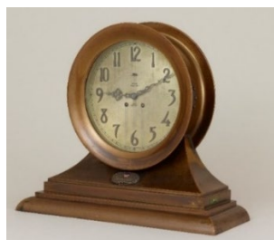
太陽鋳工(株)所蔵、神戸市立博物館寄託