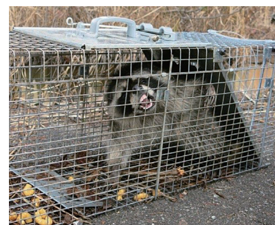
有害鳥獣・外来生物対策

利子所得として20.315%(所得税・復興特別所得税 15.315%+地方税 5%)が課税されます。