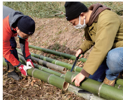
多井畑西地区の里山保全・活用

下記の取扱金融機関にてご購入いただけます。(神戸市役所では販売していません) ご購入の際には、必要な手続きが各金融機関によって異なる場合があります。 口座管理手数料等が必要となる場合がありますので事前に取扱金融機関にご確認ください。