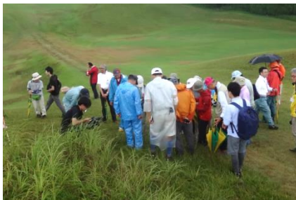
一般向け草原生植物観察会