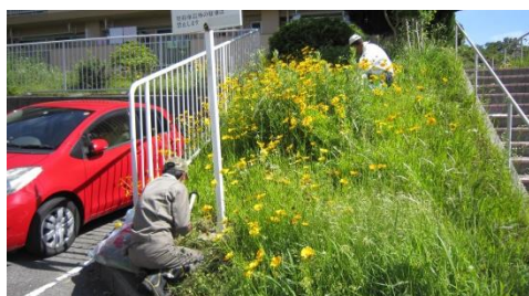
市民によるオオキンケイギク防除活動の様子