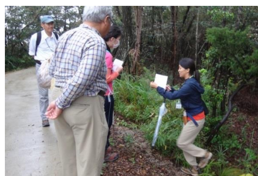
キーナの森観察会