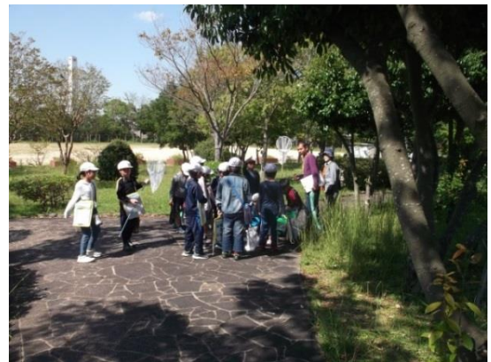
出前授業実施の様子