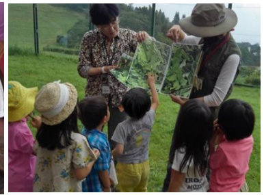
親子自然体験プログラム