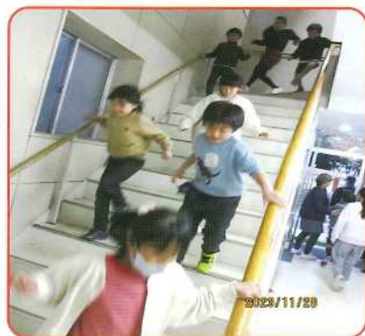
学童の避難訓練の一例

▷訓練の結果 参加者は、学童27名 指導者4名・地域参加者9名 計40名 訓練状況は、以下の通り。