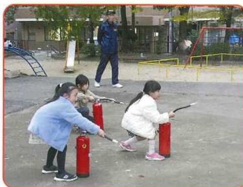
学童の消火訓練の一例