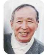
西灘ふれまち協副委員長 和光会会長