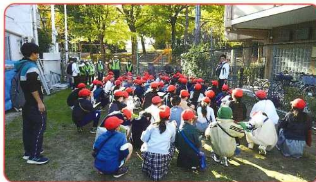
巡回前の学習要領のポイント説明