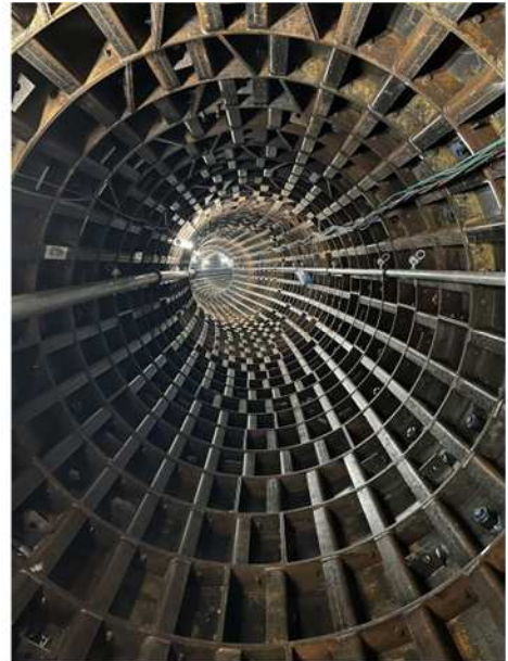
③雨水幹線への取込管（中間立坑から推進工法で施工しています）