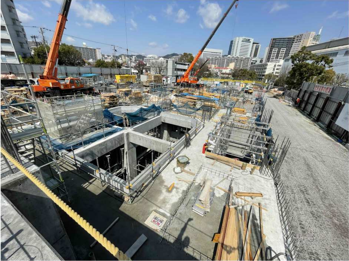
⑤放流きょ（1900mm×1900mmの管きょを整備中です）