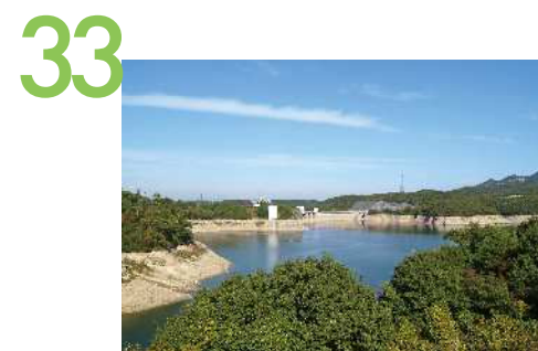
つくはら湖 つくはら湖沿いの道路際の休憩展望広場からの眺望景観で、吞吐ダムの堤体や水面を望むことができる。