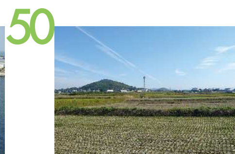
神出バイパス 田園の中を通るバイパス道路からの眺望景観で、雄岡山、雌岡山の並んだ光景が田園の広がりの中で象徴的に眺められる。