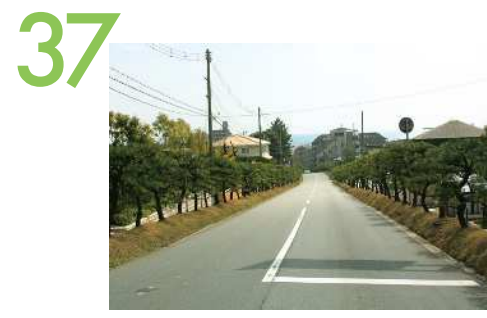
離宮道 須磨離宮公園の正門から南へ下る離宮道の眺望景観で、松並木の個性的な街路樹や石垣、塀などが海への視線を強く誘導している。