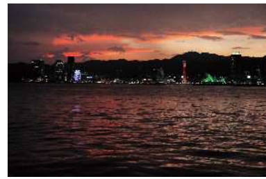
しおさい公園からの夜景