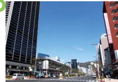
フラワーロード 神戸のシンボルロードであるフラワーロードの眺望景観で、広幅員のすっきりとした道路空間が南北への視線を誘導している。