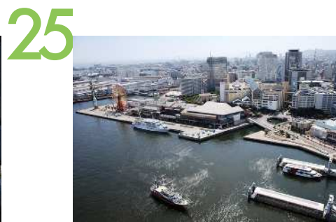
ポートタワー ポートタワー展望階からの眺望景観で、神戸のみならず市街地の全景を眺めることができる。