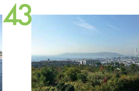
井植記念館 塩屋ジェームス山の丘陵部にある井植記念館前庭からの眺望景観で、東は鉢伏山から西は垂水の街並みや明石海峡が一望できる。