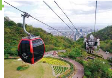
神戸布引ロープウェイ ロープウェイからの眺望景観で、六甲の山並み、神戸の市街地、海、神戸空港等が見渡せる。