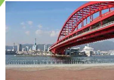
ポートアイランド北公園 北公園から北側を望む眺望景観で、山並みを背景に、神戸大橋、神戸港、HAT神戸からハーバーランドにかけての都心市街地が展開している。