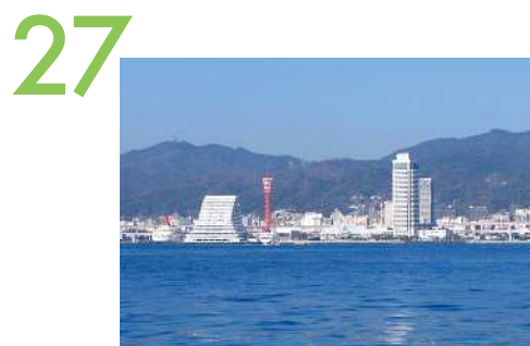
神戸港遊覧船 船上からの眺望景観で、背景に六甲山があり、市街地と海が一体で見渡せる。