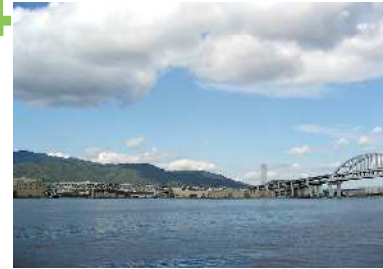
六甲アイランド北公園 六甲アイランド大橋の橋詰にある公園からの眺望景観で、六甲の山並みを背景に、倉庫やサイロ、湾岸線など東灘臨海部の風景が展開する。