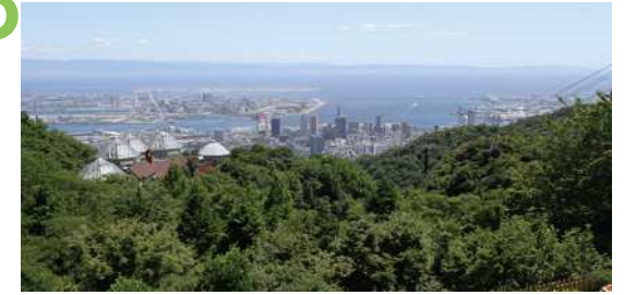
布引ハーブ園・展望広場 神戸布引ロープウェイのハーブ園山頂駅にある展望台からの眺望景観で、尾根の間から都心、ポートアイランドの市が一を見下ろす眺望景観がえられる。