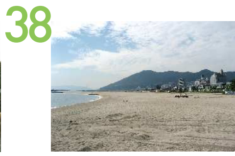
須磨海浜公園 松林を背景に広大な砂浜が続く須磨海浜公園の眺望景観で、東は須磨水族園から、西は鉢伏山あたりまで見渡せ、赤い旧和田岬灯台が松の緑に映えランドマークになっている。