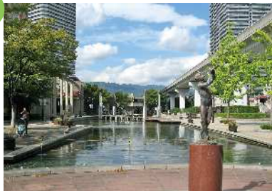
六甲アイランド・リバーモール 六甲アイランドの中央部を南北に貫くシンボル空間であり、六甲ライナーや水の流れを有した賑わい軸が山や海への視線を誘導し、うるおいのある眺望景観を形成している。