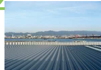
神戸空港 神戸空港展望デッキからの眺望景観で、大屋根の向こうに、六甲山の山並みを背景に、神戸スカイブリッジ、ポートアイランド、神戸港、都心市街地が広く展開している。