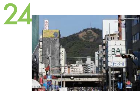
元町1丁目交差点(大丸前) 大丸百貨店西側交差点からの眺望景観で、山側はシンボルとなる錨形があり、海側はメリケンパークへの眺望路となっている。