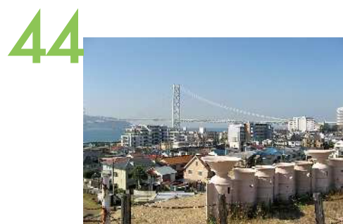
五色塚古墳 国指定史跡の古墳時代中期の前方後円墳であるが、その円墳部分からの眺望景観で、周囲全てに眺望があり、淡路島や明石海峡が見渡せる。