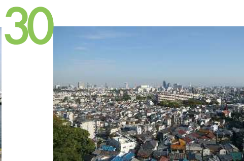
氷室町付近(山麓リボンの道) 氷室町あたりの眺望景観で、市街地と急激な高低差のある道沿いにある住宅の間や、屈曲した道の先に神戸から兵庫の市街地が展開する。