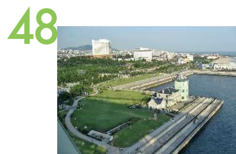
舞子海上プロムナード 明石海峡大橋の橋桁内部にある海上展望台と遊歩道からの眺望景観で、明石海峡の東西の海沿いの景色を楽しむことができる。