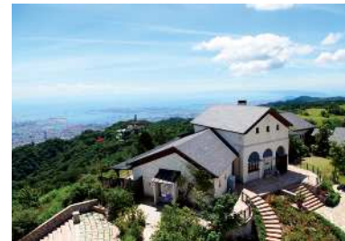
六甲ガーデンテラス 六甲の山並みの向こうに、大阪湾が一望できる眺望景観。生駒、葛城山系より和歌山方面まで見渡せる。