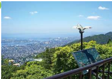
六甲天覧台（六甲ケーブル山上駅） ケーブルカーの駅上にあり、ポートアイランド、六甲アイランドの市街地を中央に、阪神間及び大阪方面の市街地、大阪湾を一望できる。