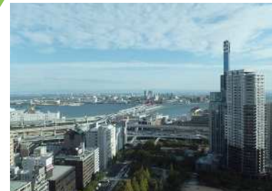
市役所1号館展望ロビー 市役所1号館24階の展望ロビーからの眺望景観で、都心部の高層ビル群の向こうに和田岬から東の大阪湾まで、みなと神戸を一望できる。