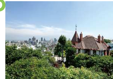
北野天満宮 北野天満宮の境内から都心を望む眺望景観で、手前の木々や風見鶏の館、北野広場の向こうに、都心のビル群が林立するのが見える。