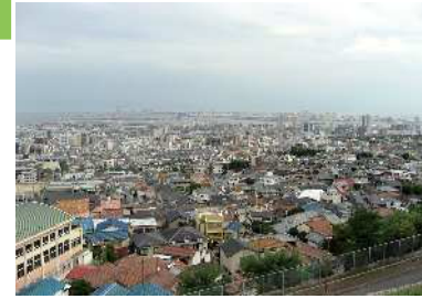
灘丸山公園 山際の高台にある公園からの眺望景観で、大阪方面をはじめ、阪神間から須磨にいたる市街地や大阪湾を見渡すことができる。