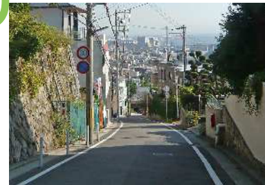
長峰坂 護国神社の裏手から長峰園園にいたる急勾配の坂道の眺望景観で、海に向かって高低差があるので、灘浜の市街地・臨海部が眼下に迫るダイナミックな眺めとなっている。