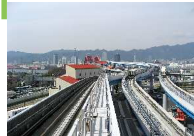
ポートライナー ポートライナーからの眺望景観で、軌道越しに山並みを背景にして、市街地や港の全景を見渡せる。