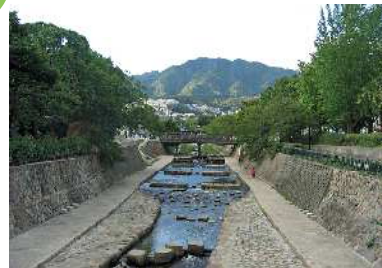
篠原橋付近（都賀川） 都賀川沿いの眺望景観で、河岸の桜並木や御影石の護岸、親水性のある河床などが山、海への視線を強く誘導している。