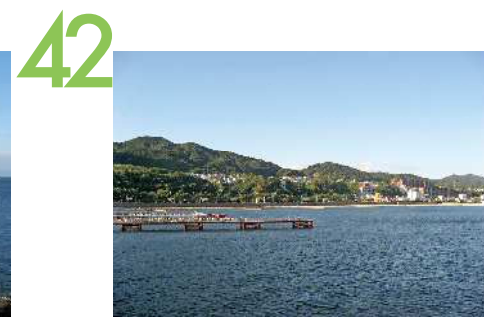
須磨海づり公園 須磨浦の海に突き出した栈橋からの眺望景観で、周囲全てに眺望があり、須磨の街並みや緑豊かな鉢伏山、須磨浦公園から明石海峡大橋、淡路島まで、海側からまちを見渡すことができる。