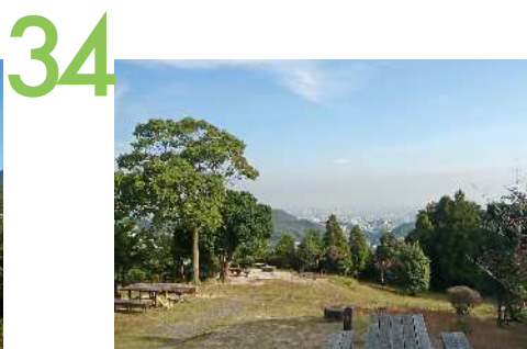
鶴越森林公園 丘陵地形の公園内、園路沿いからの眺望景観で、尾根の突端部には南に開けた展望広場があり、樹々の間から兵庫の市街地や海を望むことができる。