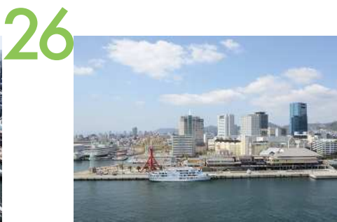
中突堤中央ターミナル 中央ターミナル前から西側の眺望景観で、ハーバーランドのビル群や造船所のクレーンやドック、クルーズ船の航行を望むことができる。