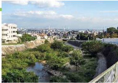
白鶴美術館付近（山麓リボンの道） 山すそに位置する白鶴美術館付近では、大きく湾曲して流れる住吉川に沿って、山と海への視線が誘導される眺望景観となっている。