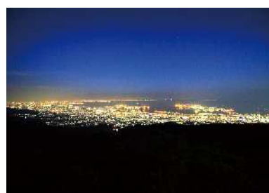
掬星台からの夜景