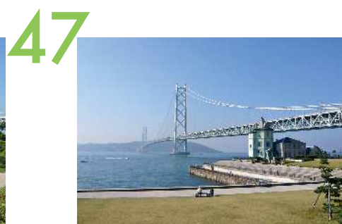
孫文記念館 移情閣と明石海峡大橋を同時に望む芝生広場からの眺望景観で、舞子公園の松林を背景に、東側のアジュール舞子と合わせてひと続きの雄大な眺めが展開している。