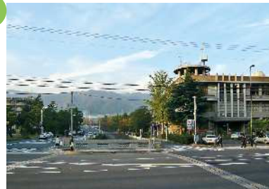
御影公会堂付近（石屋川） 石屋川沿いから山、海を見通す眺望景観で、御影石の護岸や河川沿いの松並木などによって、六甲山や海側に向かって強く視線が誘導される。御影公会堂がランドマークとなっている。