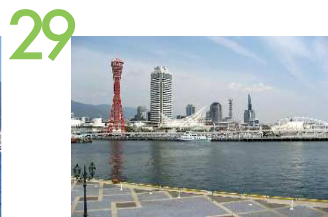
モザイク ハーバーランドモザイク展望デッキからの眺望景観で、クルーズ船が停泊し、ポートタワーや海洋博物館等の港のシンボル、その向こうに六甲の山並みやポートアイランドが見渡せる。