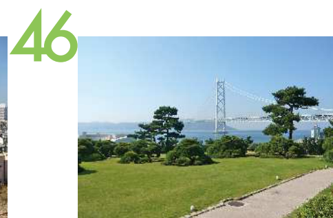
舞子ビラ 舞子ビラのデッキテラスからの眺望景観で、手入れの行き届いた芝生庭園の向こうに明石海峡大橋の全景が望まれる。