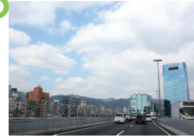
阪神高速道路3号神戸線 車上からの眺望景観で、六甲山と神戸の景色が広がる。