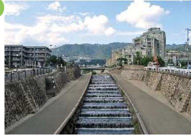
住吉橋付近（住吉川） 清流の道として親しまれている住吉川沿いの眺望景観で、御影石の護岸や河川沿いの松並木、六甲ライナーなどによって、六甲山や六甲アイランドに向かって強く視線が誘導される。