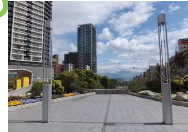
新神戸駅 生田川をまたぐ駅前デッキ広場からの眺望景観で、護岸や河川沿いの桜並木などに沿って、海に向かって視線が誘導される。