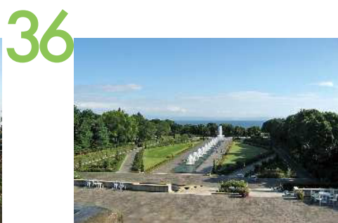
須磨離宮公園 公園内のレストハウスからの眺望景観で、噴水や生垣などの庭園のしつらえや周囲の樹木が海への視線を強く誘導し、絵画的な構成美を醸し出している。