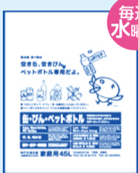
缶・びん・ ペットボトル