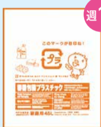
容器包装 プラスチック