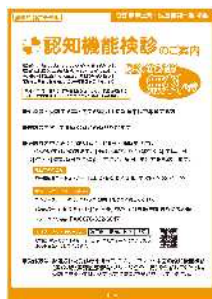
認知機能検診のご案内