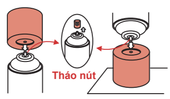
Ví dụ cách xả chất bên trong