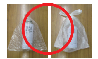
* Ví dụ túi trong suốt

3 Phân loại thành rác không cháy được, cho vào túi trong suốt (tối đa 15 lít)