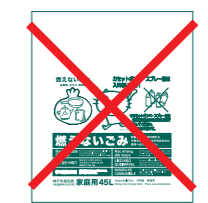
* Không thể sử dụng túi rác

4 Vứt tại trạm thu gom rác, để tách riêng vị trí với rác không cháy được