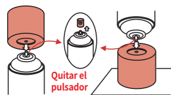
Ejemplo de cómo vaciar el contenido