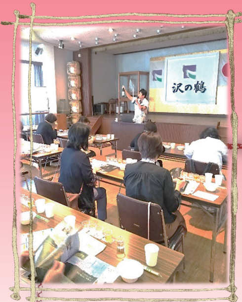
2年 文化・デザインコース 沢の鶴酒造見学 10月9日