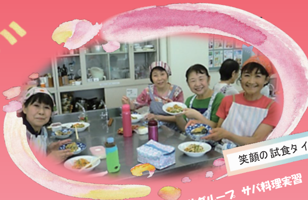
笑顔の試食タイム