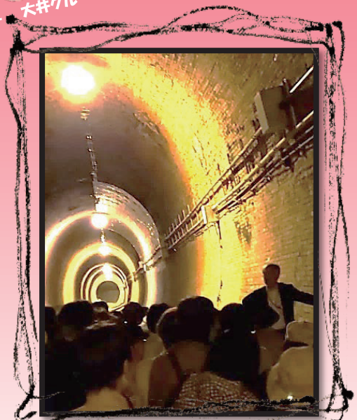
1年 湊川隧道見学 9月17日