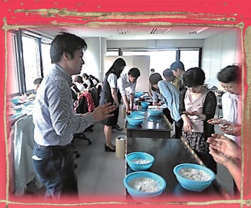
2年 生活・健康コース 大月真珠見学 9月24日