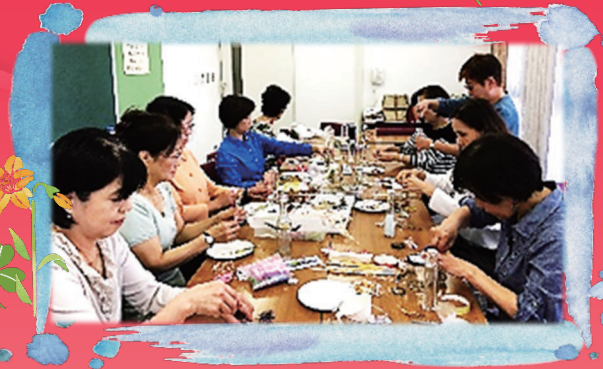
3年 久保グループ パーバルウム 10月23日