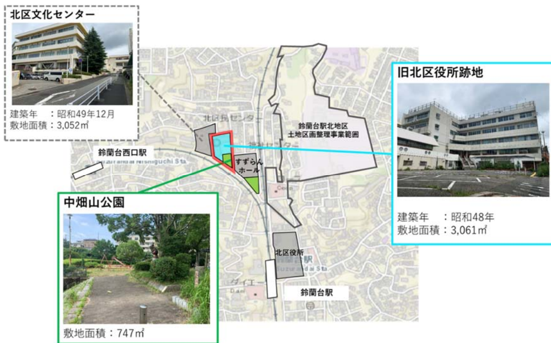
図-2 鈴蘭台駅周辺図

当該活用方針（素案）の対象範囲は、図中の赤枠内とします。ただし、鈴蘭台駅から旧北区役所跡地へのアクセスについては適宜検討の対象とします。