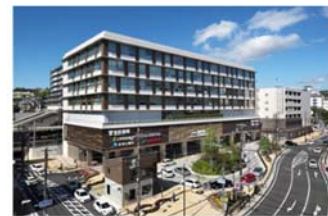
北区役所・ベルスト鈴蘭台

ここでは、鈴蘭台幹線、駅前広場、神鉄鈴蘭台駅の整備のほか、北区役所の移転拡充、商業空間の整備が行われたことで、北区の玄関口にふさわしい交通結節機能の改善とにぎわいづくりが実現しています。