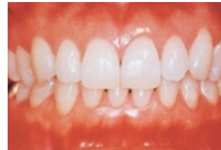
写真 丸森賢二 「健康な歯肉とブラッシング」より