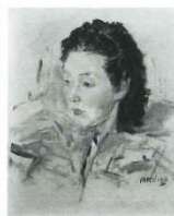
小磯良平《婦人像(ポートレート)》1948年 油彩・キャンバス