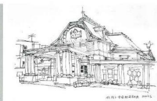
小磯良平《宝塚新演劇会館(新人国記)》1966年 インク・紙