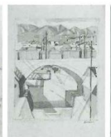
小磯良平《御影風景》1962年 水彩、コンテ紙