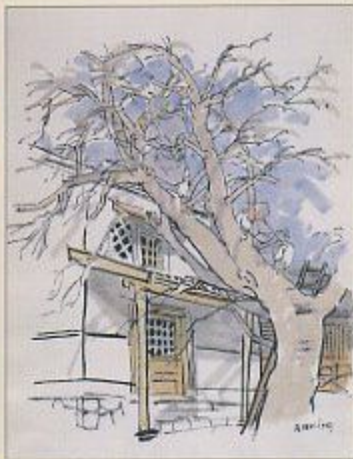
「しろばんば」挿絵原画より お茶の水図書館蔵