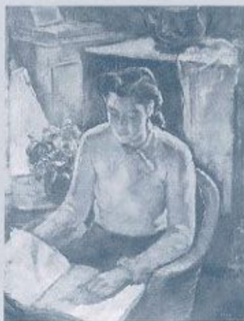
関口俊吾「花と乙女」1939年 個人蔵