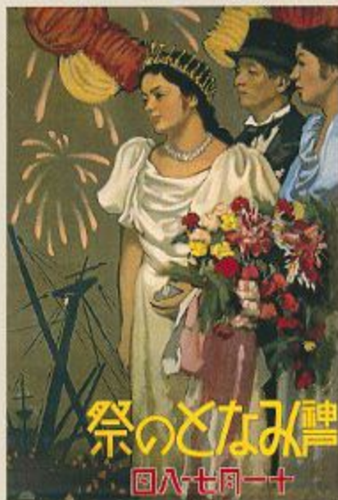
「第1回神戸みなとの祭ポスター」1933年