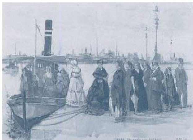
「KOBÉ, THE AMERICAN HARBOUR」兵庫県公館タペストリー原画 1909年 兵庫県公館蔵