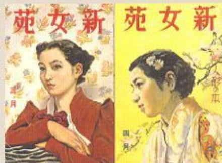
「新女苑」表紙 1937年3月号、4月号 実業之日本社発行 個人蔵