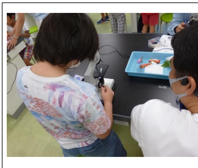
令和5年度『花粉の観察』