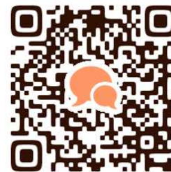
アンケートフォーム

※ 今後はいただいた生の声をご紹介します！ アンケートはこちらから募集しております♪ →