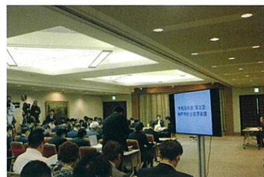
▶ 第2回総合教育会議を傍聴