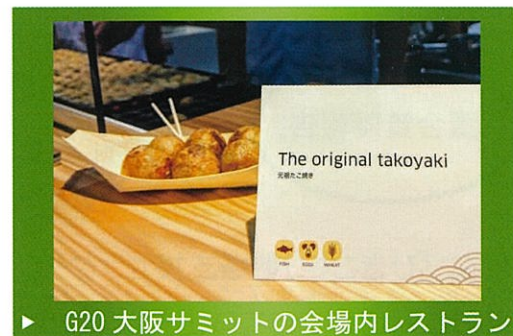
▶ G20 大阪サミットの会場内レストラン

★ 毎月末 市政報告会を開催しています。電話・メール等でご予約いただき、ぜひご参加ください。