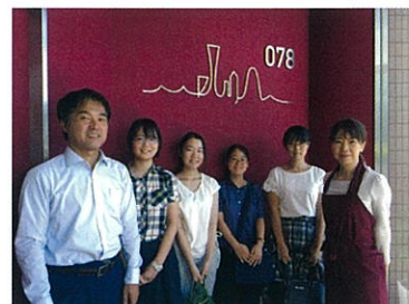
▶ 078With-Kids を訪問

経済観光局等とも連携をし、女性起業家支援のネットワークを活用しながら、いろいろなセミナーの場で広報していきたい、とのこと。