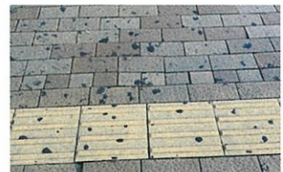
▶ 捨てられたガムが黒く残った三宮駅周辺の道路

【副市長】 現在ぽい捨て行為に罰金を設定しているが、手続きが煩雑で実行性が低い。他都市の事例(全国で10都市がぽい捨て行為に過料を設定するも6都市しか実績がない等)を参考にしながら検討したい。