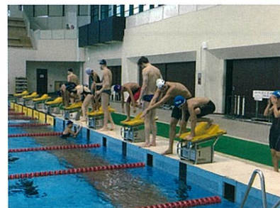
▶ 中学生への泳法指導