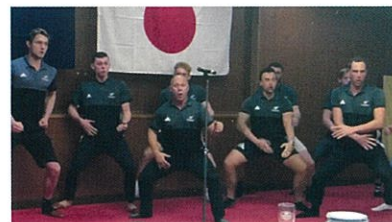
▶ 交流会で披露された「Haka」

今年の世界水選手権前に NZ の競泳チームが来神した際には、選手による泳法指導などを実施した。また、ブリスベンに子供たちを派遣し、2年連続で交流事業をするなどオーストラリアのパラチームとは既に交流を行っている。神戸に来たときに学校訪問などの交流などをやっていきたい、とのこと。