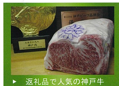
▶ 返礼品で人気の神戸牛

これから健全な運用を行ってきた団体同士の競争になることと、神戸ビーフ、スイーツ、灘の酒など神戸市には地場産品が豊富であることから、プラスの改正ではないか。