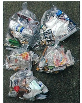
▶ 王子公園駅周辺のゴミ (5日間 朝30分間で回収)

また、灘駅周辺のような『ぽい捨て防止重点区域』も将来的には過料対象エリアとするよう要望。