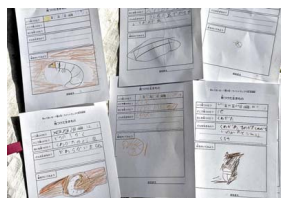
子ども虫隊メンバーのスケッチ