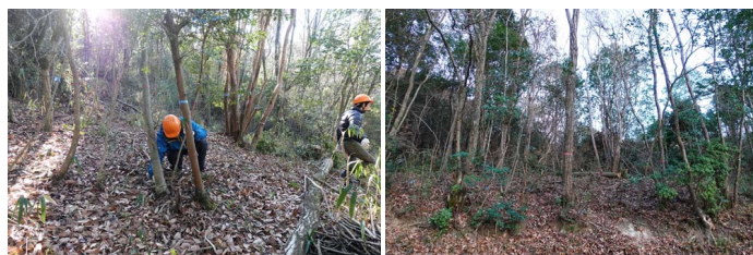
初めての伐採に挑戦中

活動広場まわりの樹林を、子どもたちが安心して遊べる場所にしていきます。ネズミモチなどの常緑樹を伐採して筋状に集積。切り株につまずいてしまわないように、伐採はなるべく地面ギリギリで。