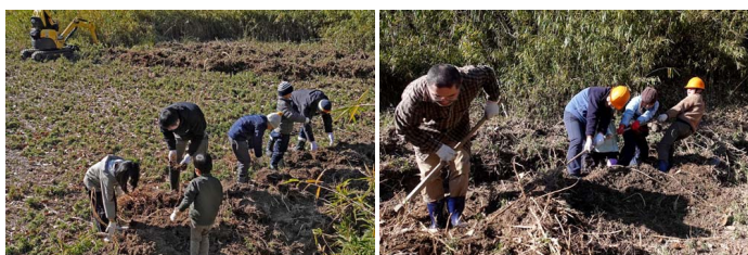
1本1本手で取り除きます

ササが生い茂っていた棚田跡を耕し、染料の材料などを育てます。ササは根が残っているとすぐに再生し、他の植物の生育を邪魔するので、地面をショベルカーで掘り返し、ササの根を取り除きました。