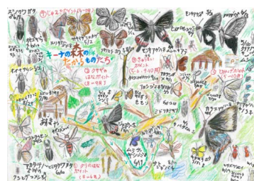
わたしの自然観察路 コンクール 応募作品 「昆虫ドキドキちょうさ」