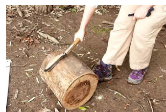
持ち手はナタで地道に。