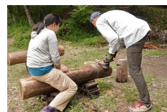
手作業で。骨が折れます…。

4月に伐採したスギを座りやすい高さに切り、持ち手をつくりました。活動広場まわりのササ刈りも。