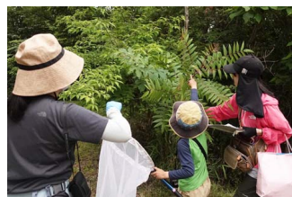
カラスザンショウに幼虫発見

主園路で調査。曇天のおかげか、アカシジミなどたくさんのチョウの仲間が飛んでいました。朽ち木ではさまざまなカミキリムシの仲間を発見。