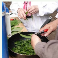
ネザサ、カキノキ、クズの葉