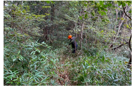
ササに埋もれた道を復活