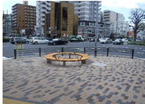
湊町線のサークルベンチ