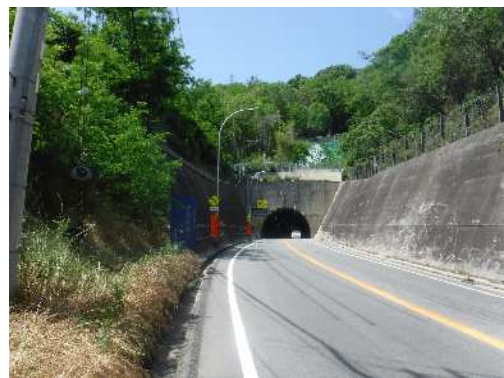
復旧後（夢野白川線）