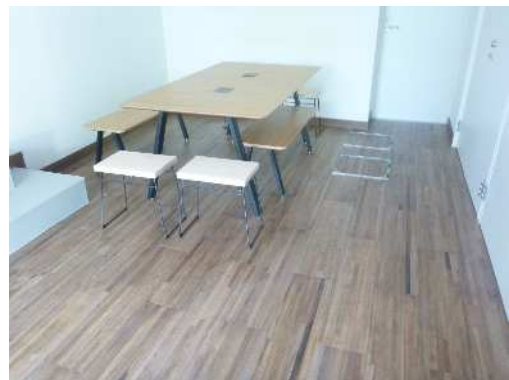
発生材の活用（六甲山ビジターセンター）