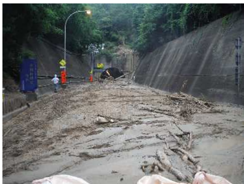
被災時（夢野白川線）

平成30年7月豪雨及び台風20号、台風21号により、市内の広範囲にわたって大きな被害を受けた。市民の安全・安心な生活を取り戻すために、道路・公園・河川・山腹斜面の復旧事業に取り組んだ。