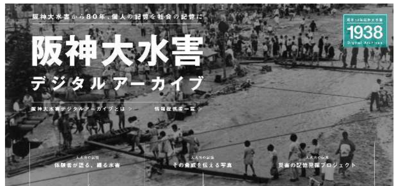
昭和 13 年阪神大水害デジタルアーカイブの作成