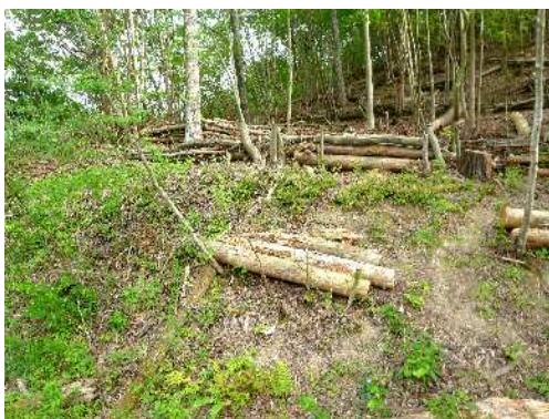
私有林の整備（下唐櫃地区）

発生材の活用においては、森林資源を活用した六甲山ブランドの確立に向けて、兵庫県や（公財）神戸市公園緑化協会との連携による取り組みを進めるとともに、公共施設を中心に内装材などへの活用を進めた。