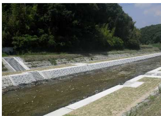
河川の改修（櫛谷川）

また、予防保全の観点から災害を未然に防止するため、よりの確な維持修繕が図れるよう河川管理施設の点検及び健全度の評価を行い、老朽化による損傷等を早期に発見し、修繕を実施した。