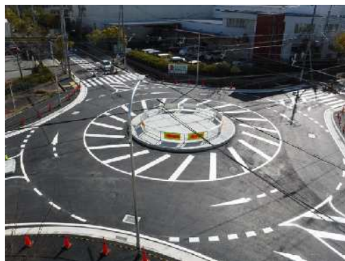
弥栄台（ラウンドアバウト）