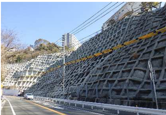
道路法面对策事例

さらに、平成 30 年度が昭和 13 年阪神大水害から 80 年の節目に当たることから、国、県等と連携し、自助・共助・公助の大切さを普及・啓発する事業を行った。