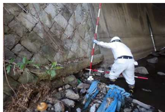
河川管理施設の点検（永井谷川）