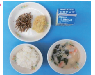
特色ある献立：正月献立

1954(昭和29)年に「学校給食法」が公布・施行され、学校給食は教育活動として実施されることになりました。時代の移り変わりと共に、子供たちの食生活を取り巻く環境は大きく変化し、学校給食の内容も変わっていきました。現在は、食に関する正しい知識と望ましい食習慣を身に付けるための「生きた教材」としての役割も担っています。