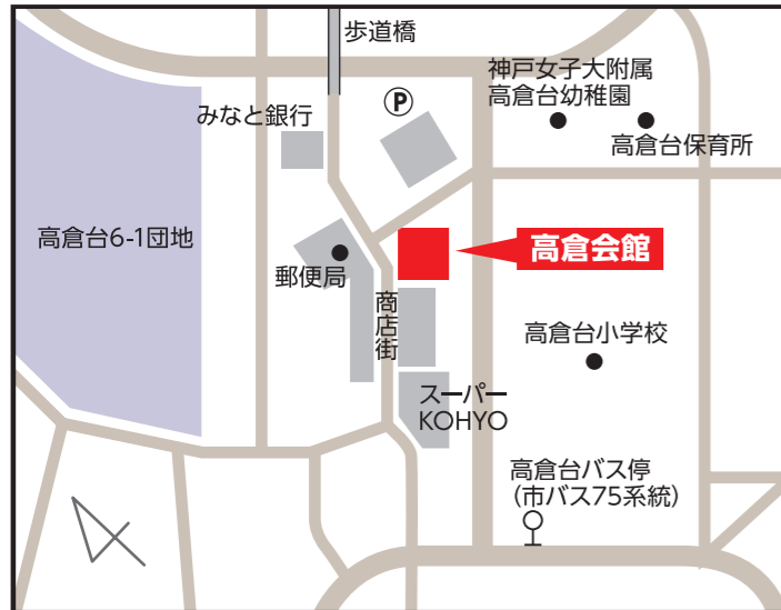
高倉会館 【須磨区高倉台4-2】