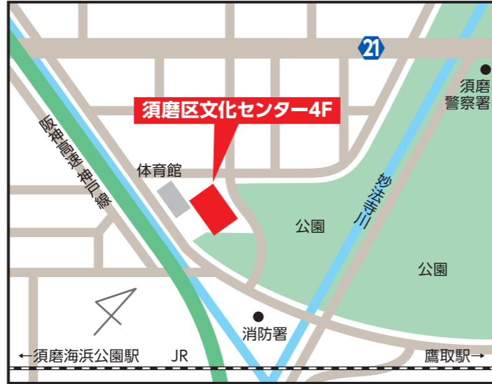
須磨区文化センター4階 【須磨区中島町1-2-3】