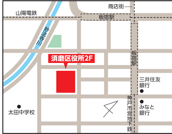
須磨区役所2階 【須磨区大黒町4-1-1】