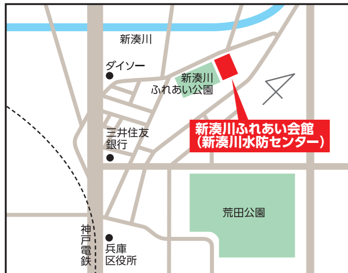
新湊川ふれあい会館(新湊川水防センター) 【兵庫区東山町1-9-20】