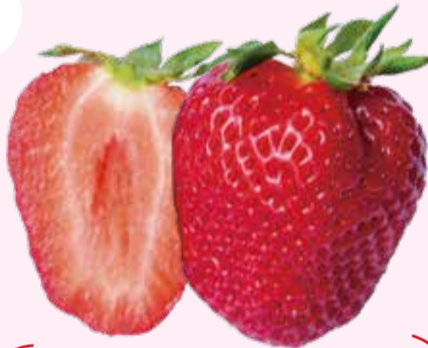
神戸ルージュ(神戸1号)

北区で最もメジャーな品種。柔らかく酸味がまろやかで、小さなお子さんも食べやすい!