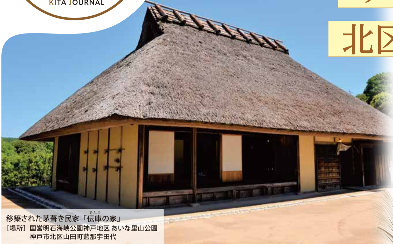
移築された茅葺き民家「伝庫の家」 [場所] 国営明石海峡公園神戸地区 あいな里山公園 神戸市北区山田町藍那宇田代

茅葺きとは「茅」というススキやヨシ、稲ワラなどを刈り取って束にしたものを材料にして屋根を葺いたものです。