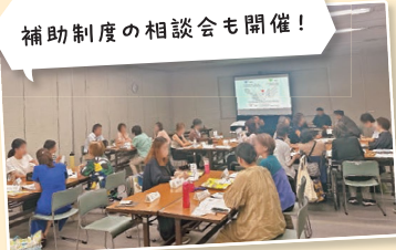
▲2023年9月のワークショップの様子