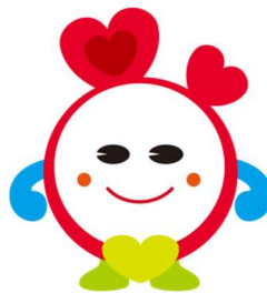
表情など細部を部分的に変更して利用