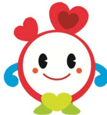
左右反転して利用