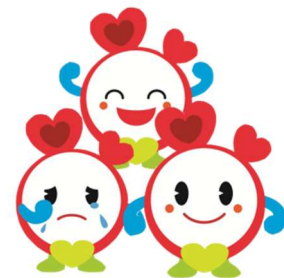
キャラクターを重ねて利用